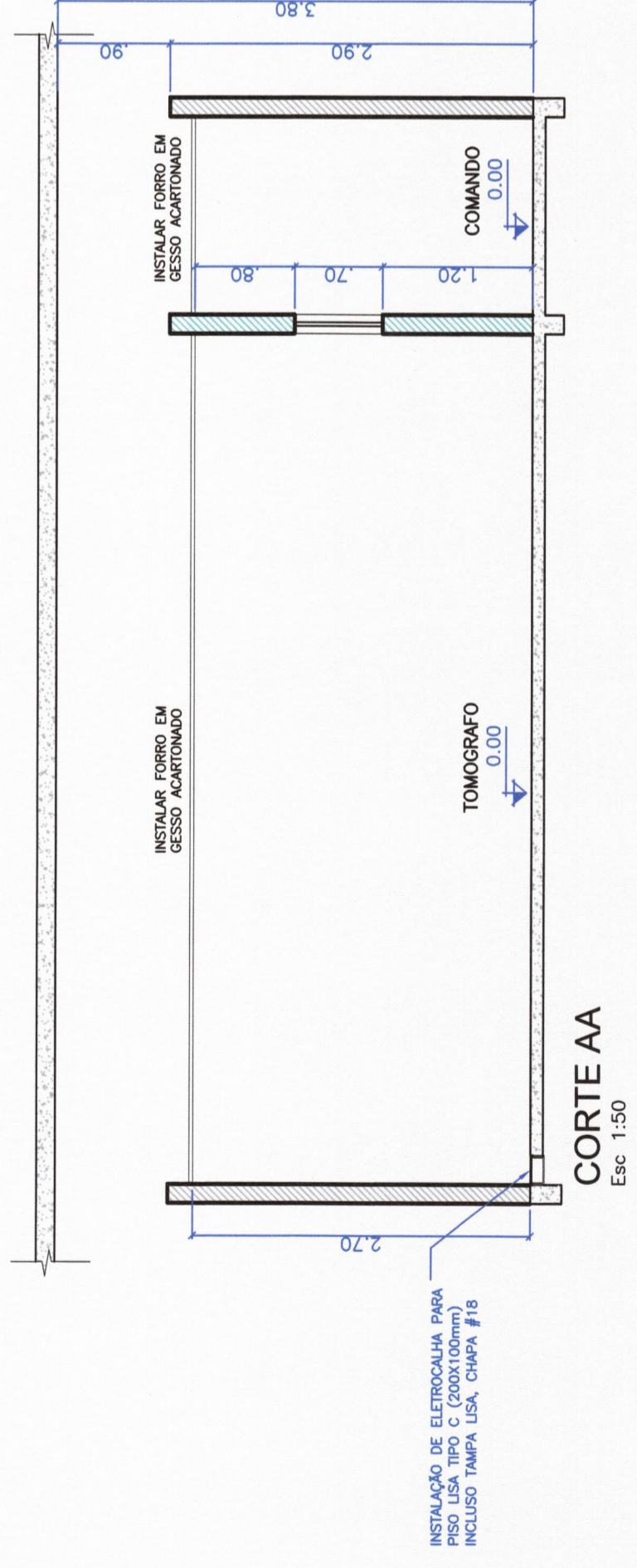
CORTE AA Esc: 1:50